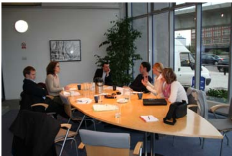
Obr.: Představitelé Jihomoravského kraje zkoumají úspěšnost inkubátoru Waterfront Studios GLE v Newhamu (na východu Londýna)

V prosinci 2006 GLE uvítala v Londýně delegaci z Jihomoravského kraje, jejíž účastníci se zabývali otázkou, jak londýnské veřejnoprávní organizace rozvíjejí podnikatelské inkubátory a bývalé průmyslové objekty, získávají zahraniční investice a poskytují podporu podnikání londýnských MSP. Tato studijní cesta byla realizována v rámci projektu "Zvyšování projektové absorpční kapacity Jihomoravského kraje", který je spolufinancován ze SROPu 3.3.